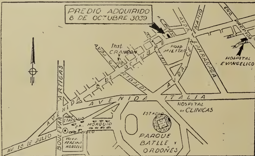
Ubicación del terreno

Otros oradores, en esta tarde, nos darán detalles interesantes e inspiradores, referentes a la colonización valdense sudamericana; por parte nuestra, queremos en primer término dar gracias a Dios quien, desde esos lejanos Valles del Piamonte en donde la vida era y es particularmente difícil, los hizo llegar felizmente a estas tierras de promisión y los bendijo abundantemente, también en sus descendientes.